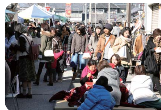
▲横町商店街をたくさんの方が埋めつくしました