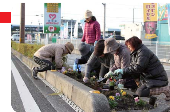
▲配色を考えながら丁寧に苗を植えました

メンバーからは「今後も沿道の店舗の協力も得ながら、取り組みを続けて、メインロードを綺麗に保ちたい」と感想が述べられていました。