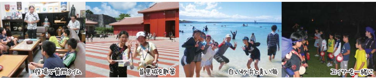
役場で質問タイム

香南市内から募集した小学5・6年生10人が、姉妹都市沖縄県八重瀬町の文化や伝統を学び、平和を考えるために、8月18日〜20日の2泊3日で訪問しました。