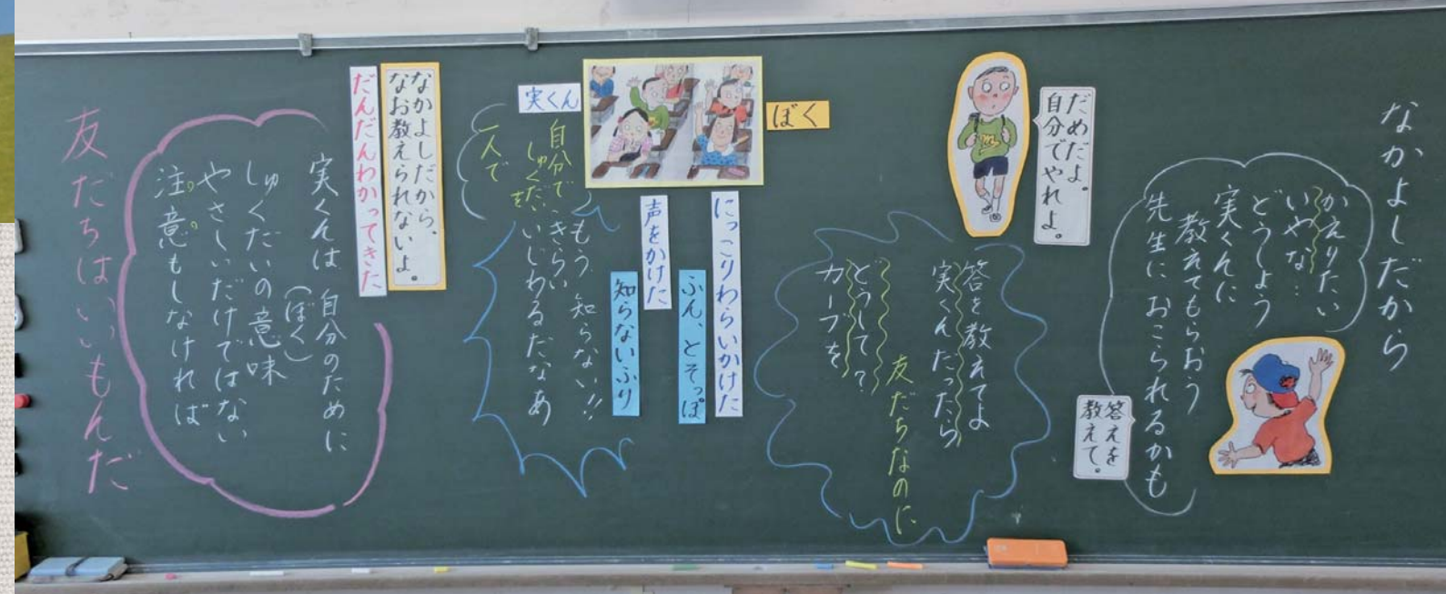
▲道徳の授業では、学習の流れを振り返ることができるように黒板への書き方が工夫されています。吹き出しに使う色に意味付けをし、視覚的に分かりやすく工夫をしています。

平成20年4月1日から指定ペットボトルに追加された5品目で♻️のマークがあるボトル 【追加5品目】しょうゆ加工品(めんつゆなど)、みりん風調味料、食酢、調味酢、ドレッシングタイプ調味料(ノンオイル) →ペットボトルへ