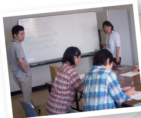
▲就労支援プログラムの学習会であいさつの練習をしている様子

☎57-7180 (香南市夜須町坪井16番1 夜須福祉センター2階) 開所日:平日9:00~17:00 (日中活動は第1・3土曜日実施しています)