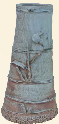
特選 陶芸「花器 雨あがり」 高瀬哲男(高知市)