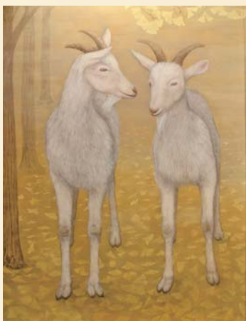
特選 日本画「好日」 市川貴子(高知市)