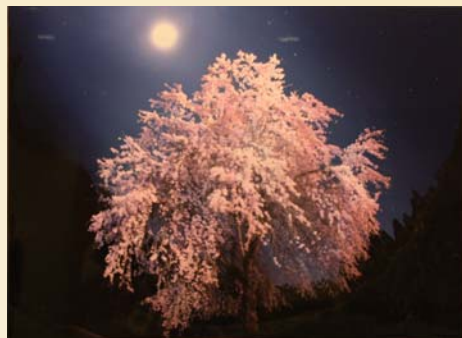
特選 写真「月光に輝く」 北村健三(土佐市)