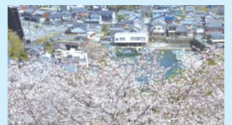
手結の内港を望む絶好のポイント。