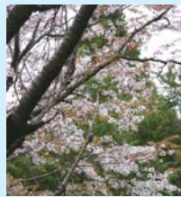
秋葉山道入口から約20分。大きな山桜が見られます。