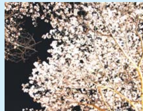
夜は21時までほんほりの点灯をしています。