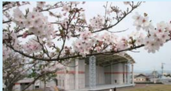
天然色劇場の芝生でのんびりと。