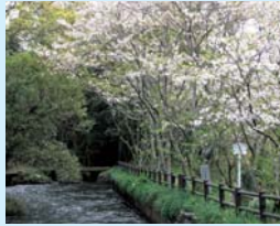
史跡「三叉」の清らかな水に浮かぶ美しい桜