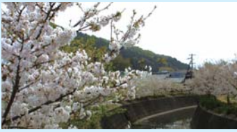
烏川の両岸に咲き誇っています。