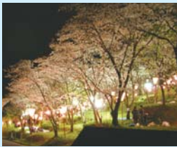
22時までライトアップされ夜桜も楽しめます。