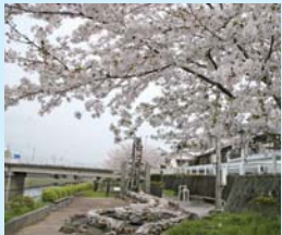
川岸に並んだ桜が見事に咲き誇ります。