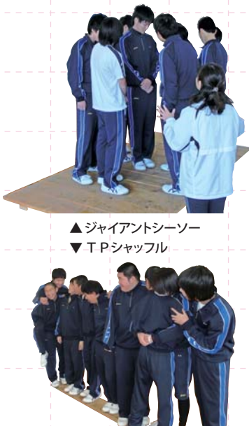
▲ジャイアントソーサー ▼TPシャッフル

心の冒険教育III 城山高校では、毎年1年生を対象に「心の冒険教育」に取り組んでいます。「心の冒険教育」とは、体を使ったグループ活動を通して、信頼関係づくりを目指す取り組みです。今年度もすでに2回行われており、3回目も1月16日(水)に実施されました。今回は全員で高知市の心の教育センター体育館に行き、そこにあるいろいろなアスレチックの道具を使って仲間作りを行うという大規模なもの。行われたのは、正方形の台から台へロープを使って全員が渡ろうとする「ニトロ」、不安定な大きな板に全員でバランスをとって乗る「ジャイアントソーサー」、細長い板の上で順番を入れ替わる「TPシャッフル」など。新鮮な活動に、生徒たちも思わず夢中になり、「ここをどうしたらいいか」「そこに動いたらうまくいくか」というように知恵を出し合いながら、全ての活動を無事終了することができました。