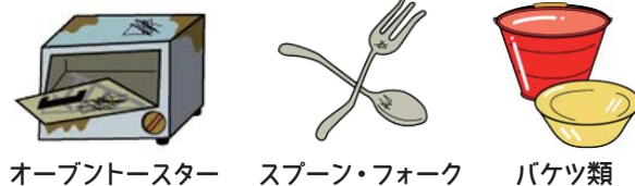
オーブントースター