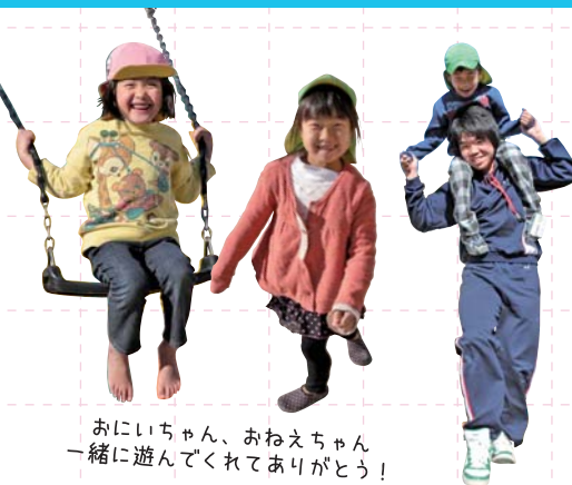
おにいちゃん、おねえちゃん一緒に遊んでくれてありがとう！

保育実習 1月10日(木)・11日(金)の両日、3年生12人が、赤岡保育所で行われた保育実習に参加しました。NPO法人高知こども図書館の方による絵本の読み聞かせや、園庭で遊んだり、給食を食べたりと、園児とのふれあいを思いっきり楽しみました。全3回の実習を通して生徒たちは、子どもを保育する大変さや難しさ、また子育てという喜びを感じたことでしょうか。