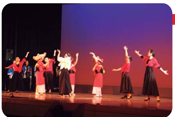
▲手結盆踊りとフラメンコが融合されました