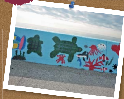
▲城山高校・吉川小学校