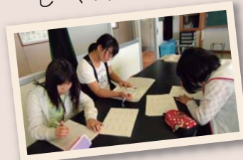
▲交通ルールも勉強します

体育館いっぱい、技能走行の練習コースが広がられていて「よろしくおねがいします」と大きな声で挨拶した後、出発の手信号を出す。まずは低速走行。10メートルの狭い道を25秒以上かけてゆっくりと進む。続くS字のコースでは、右折・左折の手信号をしながらの運転。さらに障害物を倒さないよう左右にハンドドルを操作して進むジグザグ走行、急カーブの8の字のコース、でこぼこの悪路（はしごを敷いてある）と続き、最後は少しずらした2枚の板の上を落ちないように走行する。 いずれのコースも幅が狭く、ハンドドルがふらつかないようしっかりと操作する基本と集中力が大切だ。足をついたりコースからはみ出したりすると減点となる。メン