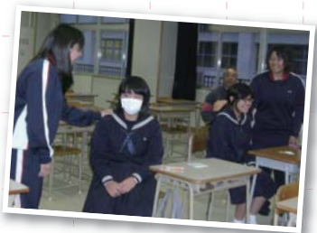
▲介護される側の気持ちを体験中 ◀中学生のやり方で、立ち上がる時の介助を実施中

福祉教科担当教員1人とヘルパー2級選択生(3年生2人)が、11月19日(月)夜須中学校、22日(木)野市中学校で「心と動きをとにもする、人と人のかかわりそのものである」をテーマに、体験型の福祉の授業を行いました。 介護をする際の言葉かけや表情、触れる感じなどを体験することも、介護技術の基本(立ち上がり、介助)について体験。「考える介護」について、感じてもらうことができました。ではないかと思えます。生徒たちは、真剣に聞く姿がありましたが笑顔も見られ、楽しく学習することができたようでした。 来年もぜひ、市内中学校に訪問し、福祉に対する理解をしていただけるよう出前授業を実施していきます。