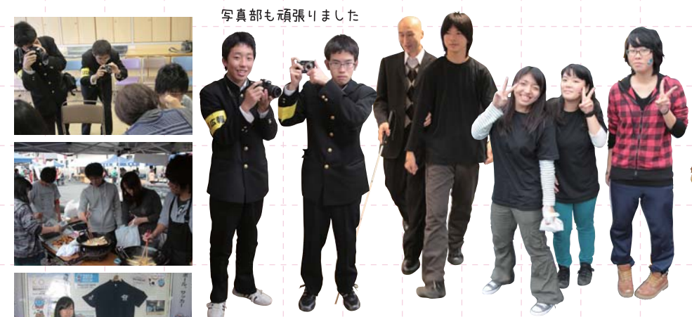
写真部も頑張りました

11月23日(金・祝)のいちふれあいセンターで開催された「香南ふれあい祭り」に、生徒19人がボランティアとして参加しました。テントの設営やスタンプラリーの受付など、イベント運営に協力。また、校内の農園で収穫したサツマイモを使った大学芋の販売を行い、お客さんに大好評でした。