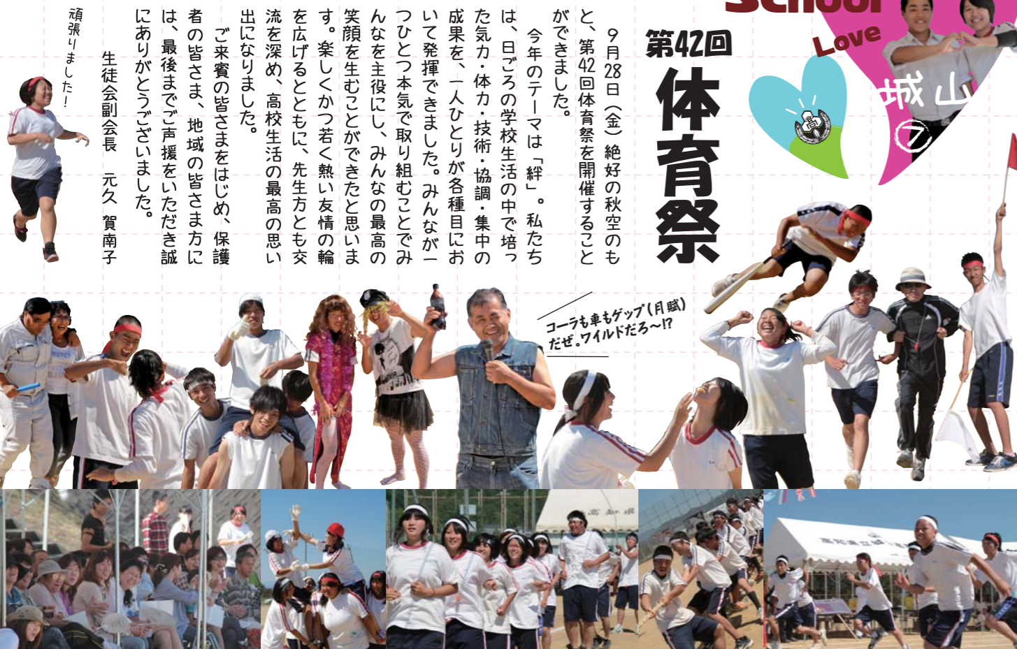
コーラも車もゲップ(月賦)だぜ。ワイルドだろ〜!?