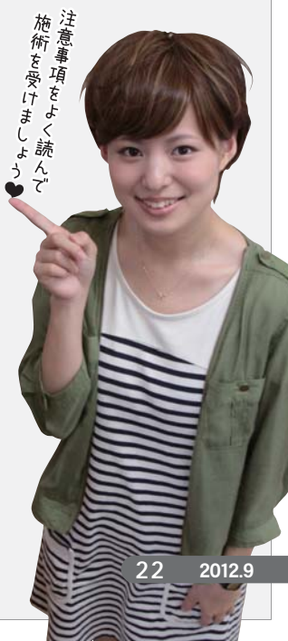
注意事項をよく読んで 施術を受けましょう

療 養費は、本来は患者が費用の全額を支払った後に、ご自身で市の国保に保険給付の請求をして支給を受ける「償還払い」が原則ですが、柔道整復については、例外的な取り扱いとして、患者が自己負担分を柔道整復師に支払い、柔道整復師が患者に代わって残りの費用を市の国保に請求する「受領委任」という方法をとっています。 このため、多くの整骨院・接骨院の窓口では、病院や診療所にかかった時と同じように自己負担分のみ支払うことにより、施術を受けることができます。