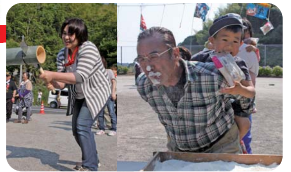
▲腰に力を入れて! (竹切り競走) ▲オ〜 粉が口に入った〜 (パン食い競走)

5月27日(日) 西川地区まちづくり協議会主催のふれあい運動会が、香我美町の西川公民館広場で行われました。中西川地区と西川地区対抗で行われた運動会ですが、出場者が足りないときには、相手チームから助っ人が入るなど終始和やか。知り合いから譲ってもらったという大漁旗がなびく中、緑あふれる山里に、みんなの笑顔と歓声が響いていました。