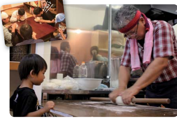
▲うどんの実演に興味津々