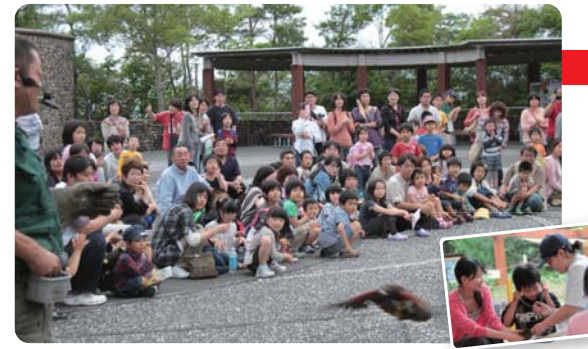
▲【写真上】バードショー 【右】獣医さんコーナー

6月2日(土)のいち動物公園で、障がいをもつ子どもたちとその家族約460人を招待し、楽しいひと時を過ごしてもらおうと「ドリームナイト・アット・ザ・ズー」が開催されました。フェイスペインティングや新聞バッグ作り、桂浜水族館による海の生き物タッチングプールなど、多彩な体験イベントが盛りだくさん。子どもたちは目を輝かせ、思う存分動物園を満喫していました。