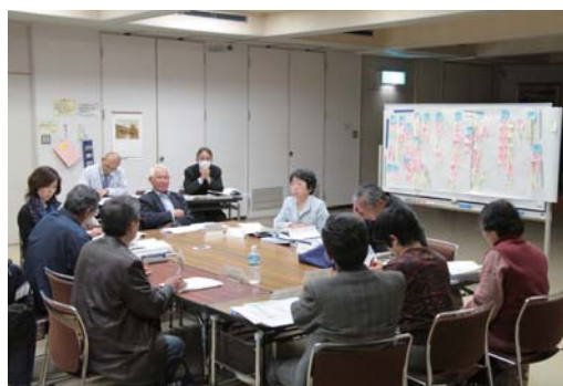
▲市民や行政、議会議員が一緒になって条例を1からつくる