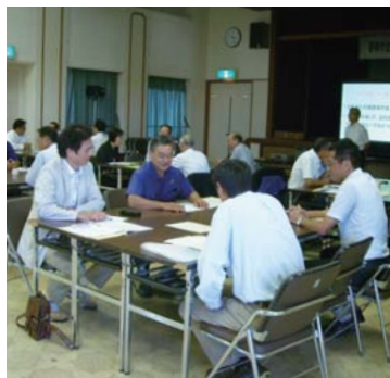
▲人権啓発センターの講師による研修会

職場内の人権意識の高揚とその環境づくりを積極的に行い、真に人権が尊重される社会を目指すため、市内企業に対して研修会などを行います。