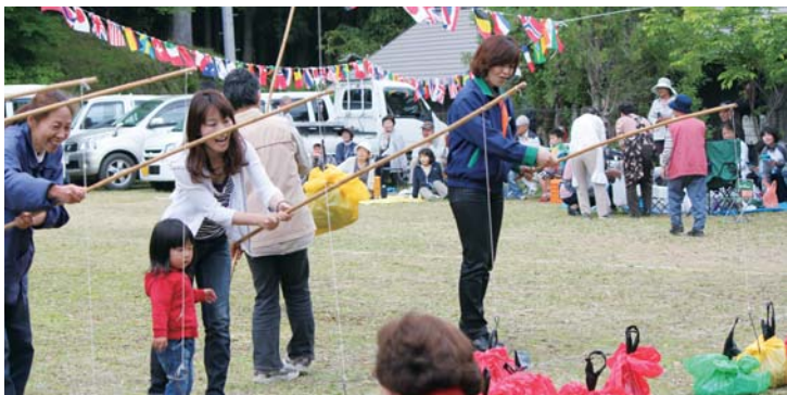
▲毎年たくさんの方が訪れる舞川地区の「ふれあい運動会」

県内以外にも来客のある舞川キャンプ場(香我美町)や羽尾大釜荘(夜須町)は、交流の場として魅力的です。 川遊び、釣り体験やウオーキングなど、継続した集客を行うために、地域住民や組織と連携し、地域に根ざした交流活動の充実を図ります。