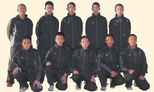
香我美中学校男子駅伝部 第62回高新中学校駅伝競走大会 男子の部 優勝