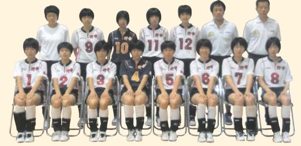
野市中学校女子バレーボール部 第65回高知県中学校総合体育大会 優勝