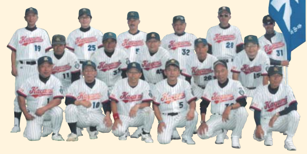
香我美町体育会実年 第20回全日本実年ソフトボール大会県予選 優勝