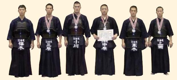
第50普通科連隊(剣道) 第43回全日本官公庁剣道大会 準優勝