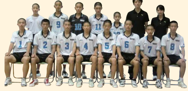
野市中学校男子バレーボール部 平成23年度高知県バレーボール秋季選手権大会 優勝