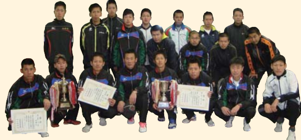
第50普通科連隊(陸上) 第64回高新駅伝大会 優勝