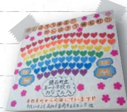
▲岸本小学校ではハートの中にメッセージを書いて贈った。

平成23年3月11日に起こった東日本大震災を受け、「香南市からできることを!」と、香我美おれんじ保育所と香我美小学校、岸本小学校の子どもたちが、鏡石町の保育所や小学校へ大きなメッセージカードなどを贈りました。鏡石町の担当者も「メッセージにのせて届けられる、顔や心が見える支援がうれしい」と話され、今後、子どもたち同士の交流へ発展することが期待されます。