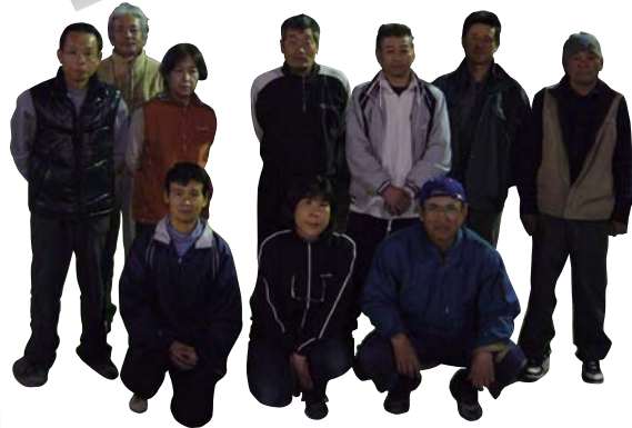
■設立:平成7年ごろ ■会員数:15人 ■練習日時:毎週水・金・日曜日 19:30~21:30 ■場所:山北公民館グラウンド