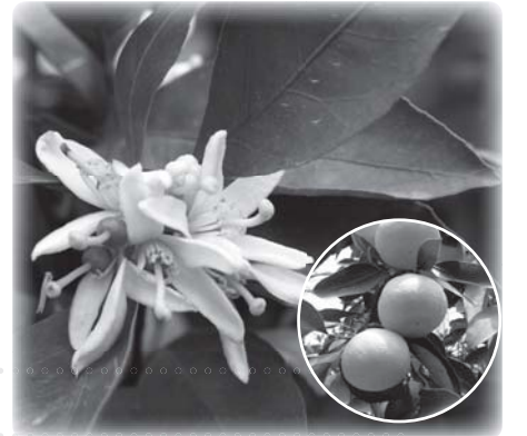
みかんの花の香りを楽しもう!