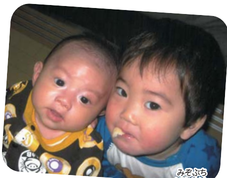
みおん 満洲 りおん 凜音くん・凜星くん 野市町