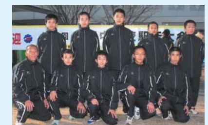
香我美中学校男子駅伝部 第61回高知中学校駅伝競走大会 男子の部優勝

この賞は、市体育協会の主催で、健康で明るく希望に満ちた香南市の創造に貢献した個人および団体を表彰するものです。