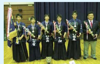
野市町スポーツ少年団剣道部 平成22年昇龍旗争奪全国選抜少年剣道大会 優勝

全国・県大会において優勝またはそれに準ずる優秀な成績の個人および団体に贈られる賞