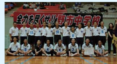
野市中学校男子バレーボール部 第64回高知県中学校総合体育大会 優勝