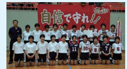
野市中学校女子バレーボール部 平成22年度高知県秋季選手権大会 優勝