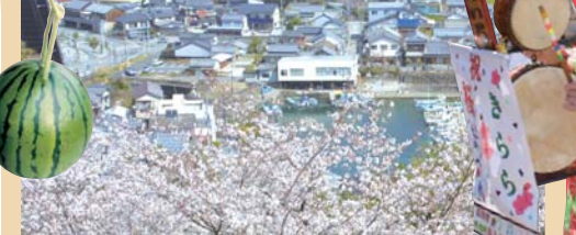
手結の内港を望む絶好の花見ポイント。

春さらさら。コート脱いで出かけよう！ 今月号は、これから見ごろを迎える市内の桜の名所や、お花見ポイントを紹介します。 ■問い合わせ 商工水産課 ☎57-17520