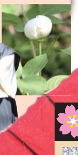
長谷寺の境内に見られる山シャクナゲ