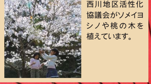
西川地区活性化協議会がソメイシノや桃の木を植えています。