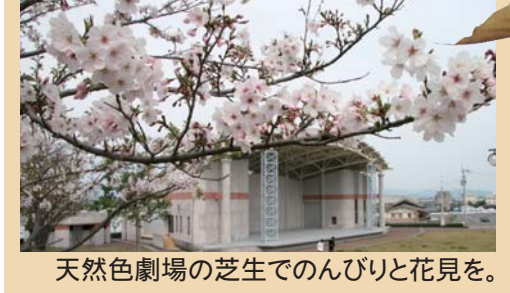
天然色劇場の芝生でのんびりと花見を。