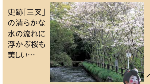
史跡「三叉」の清らかな水の流に浮かぶ桜も美しい...