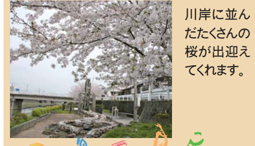
川岸に並んだたくさんの桜が出迎えてくれます。

注 今回掲載した桜の花見ポイントは公共の場所です。ゴミを捨てたり、人の迷惑になる行為は許されません。ご注意ください!