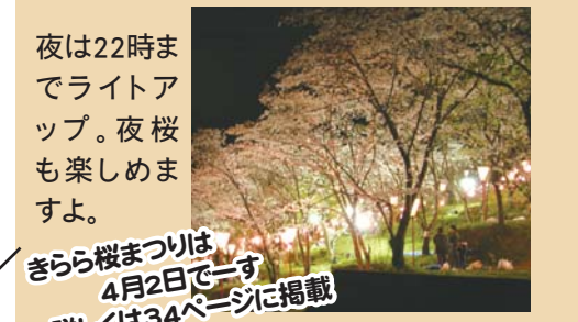
夜は22時までライトアップ。夜桜も楽しめますよ。