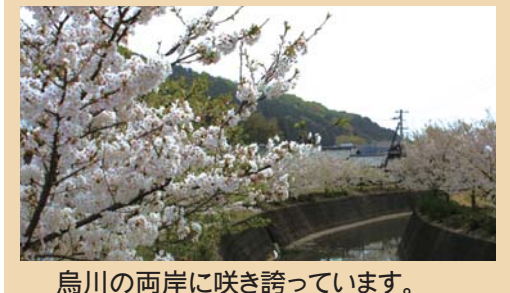
烏川の両岸に咲き誇っています。