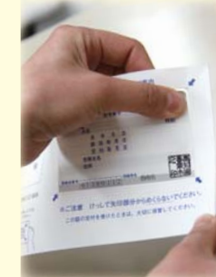
保険証は切り取ってお使いください

平成23年度の新しい保険証を3月下旬に郵送します。保険証はピンク色の封筒に入れて、世帯員全員分を一つの封筒で郵送します。重なっている場合があるので十分にご確認ください。