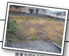
南東方向から撮影