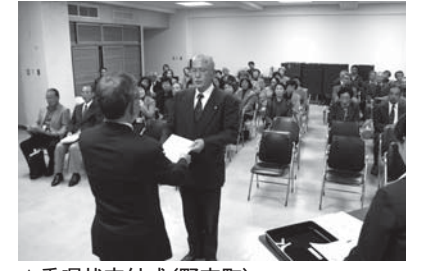
▲委嘱状交付式(野市町)

平成22年12月1日、民生委員・児童委員が全国一斉に改選され、香南市では民生委員・児童委員100人、主任児童委員(児童問題を専門に担当)10人の皆さんが、厚生労働大臣の委嘱を受けました。任期は、22年12月1日から25年11月30日までの3年間で、受け持ち世帯は1人あたり平均約140世帯です。 市内を旧町村単位で5地区(赤岡町、香我美町、野市町、夜須町、吉川町)に分けて協議会を組織し、温かな地域社会づくりを目指して、地域に根ざした福祉活動を行っています。