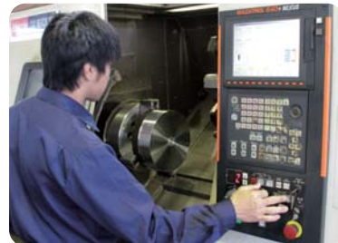
【CNC複合旋盤】 コンピュータ制御により鉄をさまざまな形や穴を開ける装置