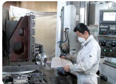
【NC横中ぐりフライス盤】 製品に穴を開ける装置