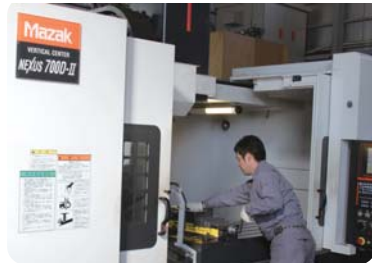
【マシニングセンター】 自動で多彩な製品を作成する装置