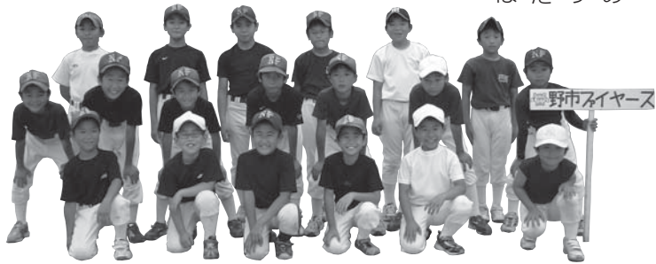
■設立:平成6年■会員数:20人■練習:火・木(18:00~20:00)・土(13:00~※夏場は8:30~12:30) / 野市小・吉川小グラウンド