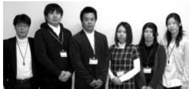
実現チームのメンバー

香南市地域雇用創造協議会内に、「実現チーム」 が設置され、6人が就任しました。 このチームは、体験型観光の旅行商品の企画立案や、一次産業を活用した商品の開発、地域で作られる加工品の販売戦略を確立するなど、地域のアイデアを活用した香南ブランドを開発することを目指しています。 就任期間2年2カ月の間、地域の皆さまには、実現チームへのご理解とご協力をお願いいたします。