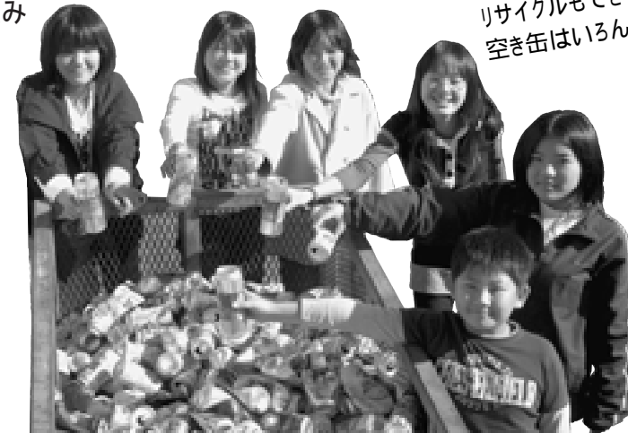
赤岡小学校児童会のメンバー

私たちが「カンカンキッズ」は、家庭から出たカンや道路などに捨てられたカンを集めています。地域にこの活動チラシを配布すると、地域の人たちも空き缶を学校に持ってきてくれるようになりました。集めたカンの収益は、地域に役立てたり、学校で使う物などに活用したいと思います。