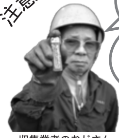
収集業者のおじさん

カン類の中には、ライターもよく見かけます。ライターをスクラップすると爆発し非常に危険です。必ず粗大ゴミで出すようにしてください。たばこの吸い殻も絶対にいれないでください。不適物の入ったカンは、リサイクルできません。