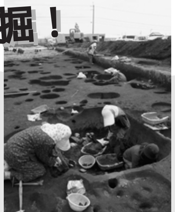
3月は野市町西野遺跡群を発掘

香南市では各所で農道整備や宅地開発に伴う、埋蔵文化財の有無の調査と保護をおこなっています。出土した生活の跡や土器などには、当時の生活や歴史の背景を知る手がかりが秘められています。