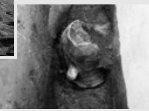
カマドから出土した甑