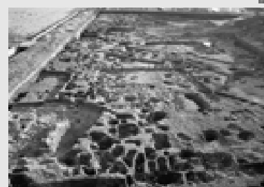
掘り終えた昔の生活跡