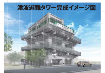
( )内は完成予定時期