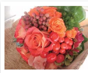
▲写真はイメージです