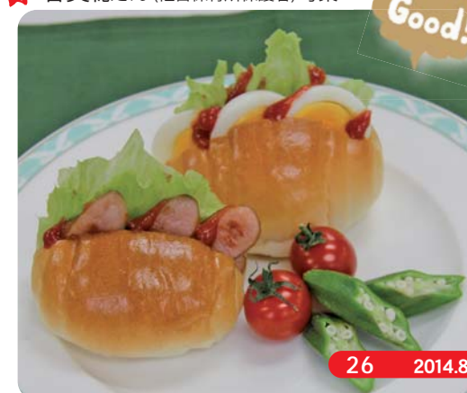
※レシピ集作成時(平成25年度)に掲載しています