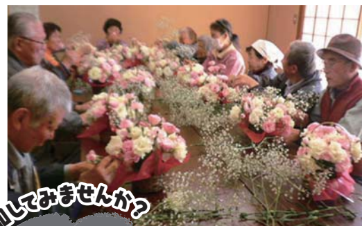
▼夜須町添地ニコニコ会

住宅改修費の受領委任払いが始まります 生活保護受給者または住民税非課税世帯の人で、改修費を一旦全額支払うことが困難な人を対象とした「受領委任払い」制度が今月から始まります。 これは、利用者が1割のみを支払い、残りの9割を市が住宅改修事業者に支払うことができる制度です。申請の手続きはお問い合わせください。