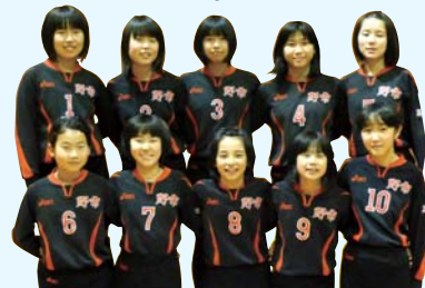
野市ジュニアバレーボールクラブ(女子) 第23回高知県小学生バレーボール春期選手権大会 女子の部 優勝