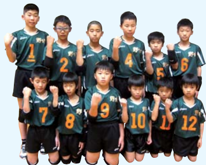
野市ジュニアバレーボールクラブ(男子) 第11回全国スポーツ少年団バレーボール交流大会 男子の部 優勝