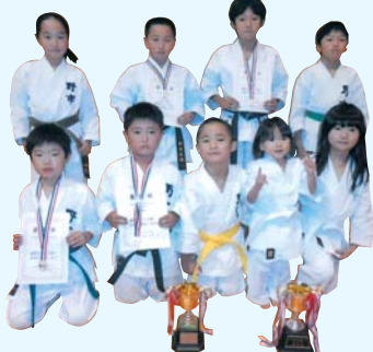
空手道野市道場スポーツ少年団 第28回高知県小学生空手道大会 男子団体組手の部 優勝