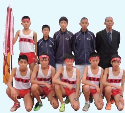
香我美中学校男子駅伝部 第64回高知中学校駅伝大会 優勝