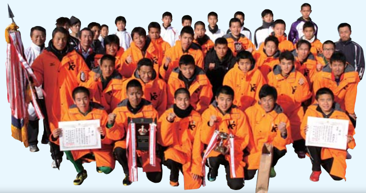
香南市駅伝チーム 第62回高知県市町村対抗駅伝競走 優勝(Aチーム)