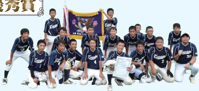
香我美中学校ソフトボール部 第65回高知県中学校ソフトボール選手権大会 優勝