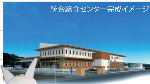
統合給食センター完成イメージ

水道事業経営のために設けられた、独立採算性の会計で収入の大部分は私たちが支払う水道使用料です。