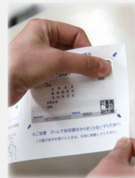
保険証は切り取って お使いください