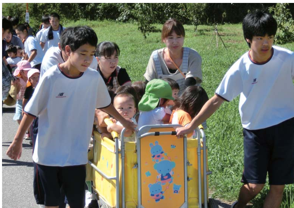
▲夜須地域で保育園児から中学生まで合同で行った避難訓練

香南市内の小中学校では、子どもたちの命を守るため、各校の「防災教育指導計画」や「学校防災マニュアル」に基づいて、防災教育に取り組んでいます。 その中でも、地域ぐるみで特色ある取り組みを行っている夜須地域と香我美町岸本地域を紹介します。