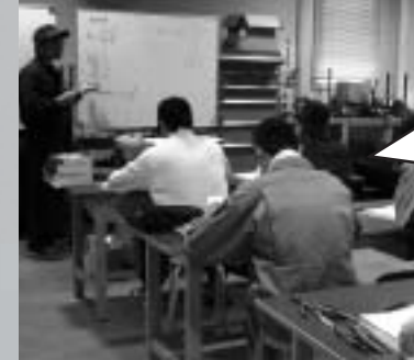
▲フライス加工講義

製造業でありながら他の分野に従事しているためフライス盤を使用する機会がありませんでした。今回の研修で、知識の幅が広がりました。