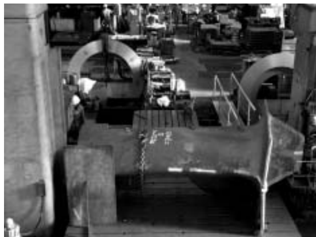
▲2台の横中グリ盤で同時に加工をしているところです