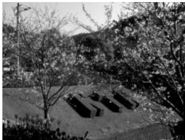
▲平成13年に「緑化優良工場」に選ばれました

Kind (親切・優しい) Trust (信頼・信用) Knowledge (知識) を経営理念とし「ユーザーとともに歩む」を合言葉に、K T K のチャレンジ精神でこれからも躍進していくつもりです。