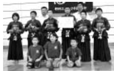
野市スポーツ少年団剣道部のメンバー