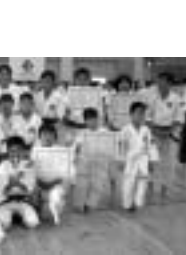
優秀な成績を収め、全国大会出場を果たした高知野市チームのメンバー