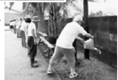
自主防災組織の消火訓練(バケツリレー)