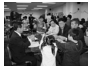
すっきりタウン発表会

7月8日フジでフン取り器を配らせてもらいました。用意した120本のうち、103本も配れました。予想以上に多くの方が持って帰ってくれました。