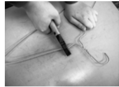
① ワイヤーハンガーのわ がっているところを切り取る。