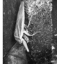
卵を守る父タガメ