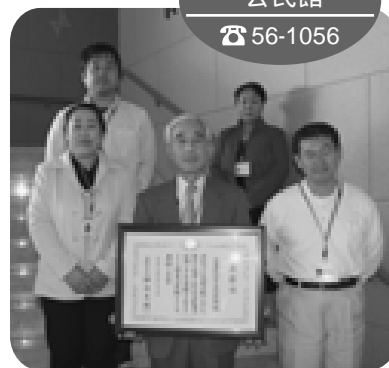
野市中央 公民館 ☎ 56-1056

このたび、第59回優良公民館として文部科学大臣の表彰を受けることができました。これからも市民の皆さんに親しまれる身近な公民館を目指して取り組んでいきますので、サークル活動や学習会など、大いにご利用ください。