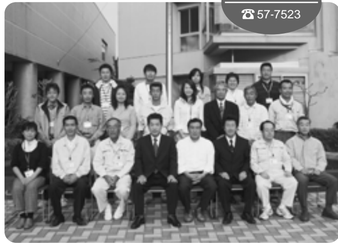
生涯学習課 ☎ 57-7523

職員は、生涯学習係や文化振興保護係、スポーツ振興係、青少年育成係、補導センター職員と合わせて23人のスタッフがいます。また社会教育施設として各公民館や図書館(室)、野市総合体育館など、たくさんの職員が頑張っています。