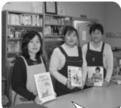
香我美図書館 ☎ 55-0022

このたび、第59回優良公民館として文部科学大臣の表彰を受けることができました。これからも市民の皆さんに親しまれる身近な公民館を目指して取り組んでいきますので、サークル活動や学習会など、大いにご利用ください。