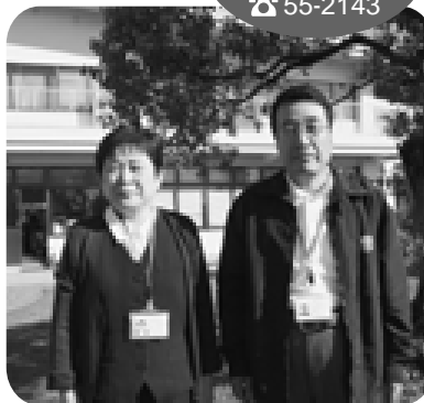
香我美市民館 ☎ 55-2143

市民館では「かがみスポーツクラブ」「みかんネット香南(パソコン教室等)」も活動していますので、気軽に声をかけてください。