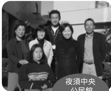
夜須中央 公民館 ☎ 54-2121