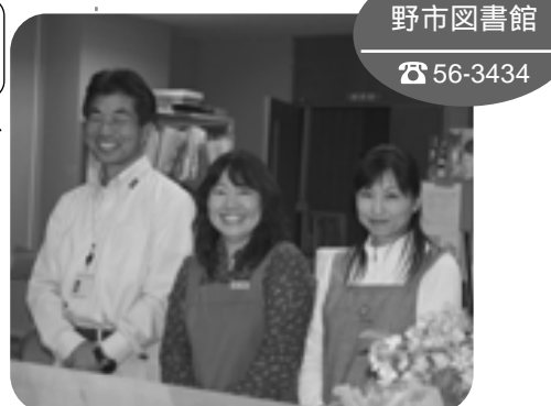
野市図書館 ☎ 56-3434