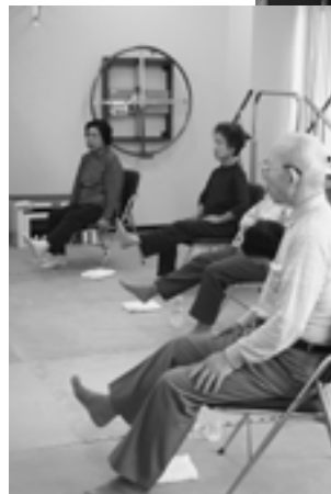
みんなで健康体操