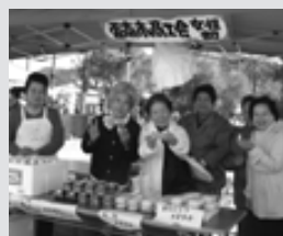
まあ食べて!おいしいき