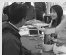
あなたはサラサラ? 血液チェックは大人気