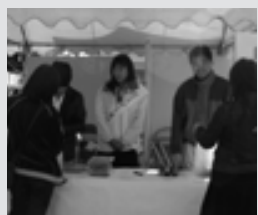
ミスマーメイドも一役