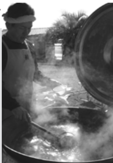
湯気がたち上がる豪快な大鍋の中は名物トロメ汁