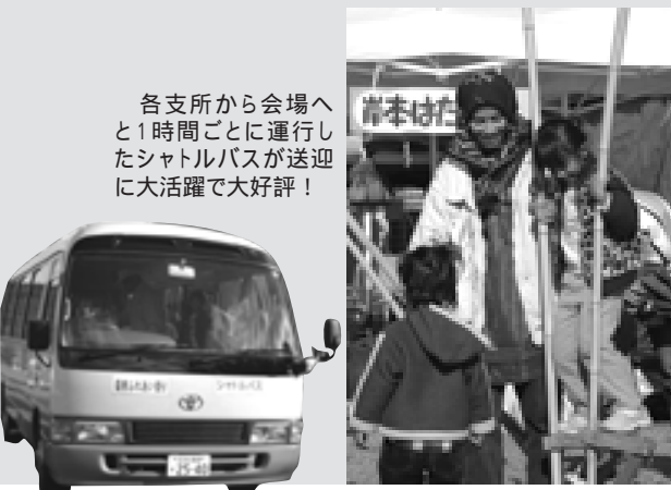
各支所から会場へと1時間ごとに運行したシャトルバスが送迎に大活躍で大好評!