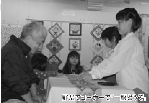
野だてコーナーで「一服どうぞ」