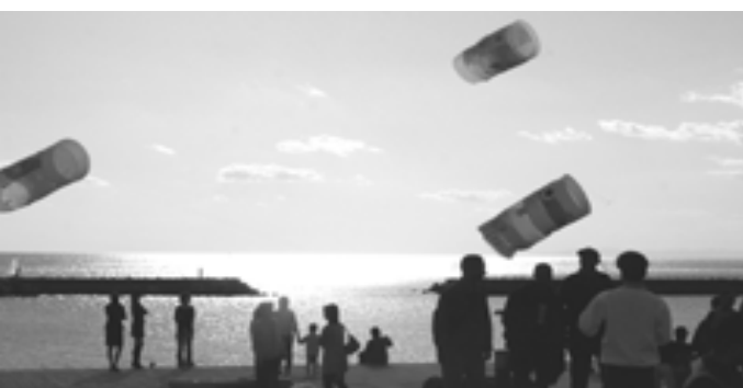
色とりどりのたこが空と海にぶかぶかとイイ気持ち