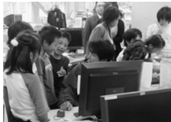
自分たちの記事がパソコンで編集される様子を見学