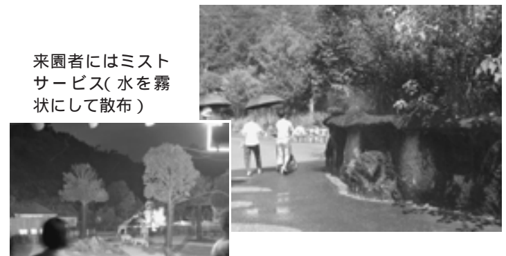
「のいちdeナイト」ではキリンの走る姿が見られるかも？

ペンギンたちはスプリンクラーの下へ集まっています。風通しはあまり良くありません。暑さをやわらげる様々な工夫をしています。ペンギン舎ではスプリンクラーを回して、動き始めるとわらわらとその周りに