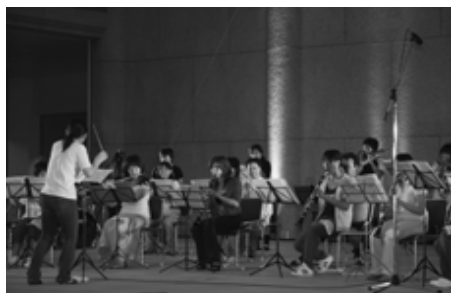
祭りを盛り上げるラッキーストリームの演奏

神事に始まり、20隻の漁船による「大漁旗パレード」や子どもたちに大人気の「ウナギつかみ大会」、若竹会による「太鼓・獅子舞」、赤岡中学校吹奏楽部OBを中心とした「ラッキーストリームウィンドオーケストラ演奏会」などが行われ、900発の打ち上げ花火がフィナーレを飾りました。