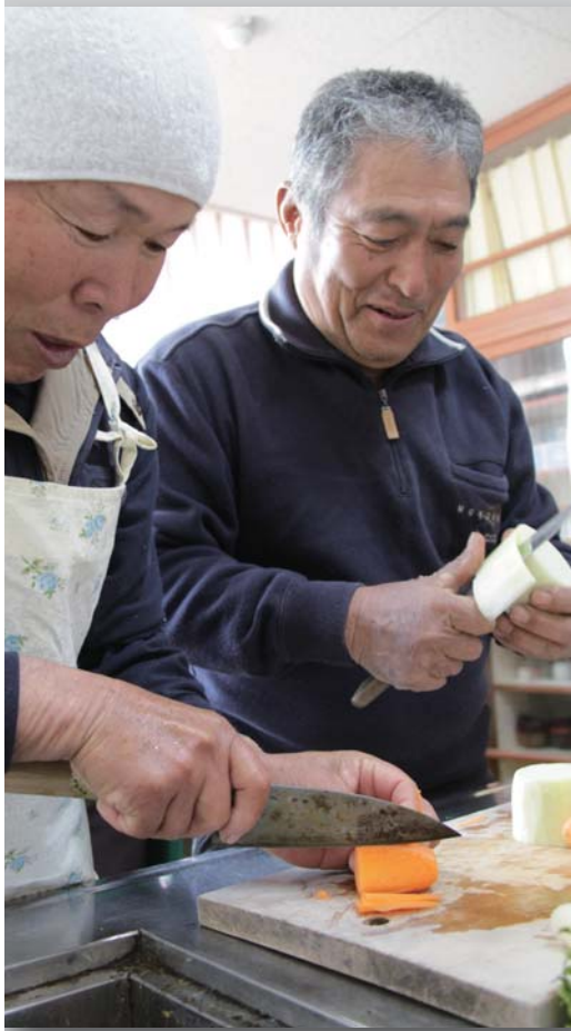
▲ 男の料理教室 料理をつくった後は みんなでの試食も楽しみの一つ