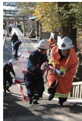
▲須留田八幡宮での訓練

24日の訓練は、平成15年1月1日に連続放火により消失した仁井田十二所神社で実施され、消防車5台、夜須消防団員50人が参加。早朝の6時40分に訓練を開始しました。また、26日の訓練は、県指定有形文化財の絵金屏風絵が収納されている須留田八幡宮で実施され、消防車3台、消防署員10人、赤岡消防団員15人が参加。午前9時30分に神社境内より出火、延焼中との想定で行い、参加者には、訓練内容が事前に分からないように訓練を実施しました。