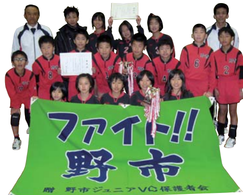
野市ジュニアVC保護者会