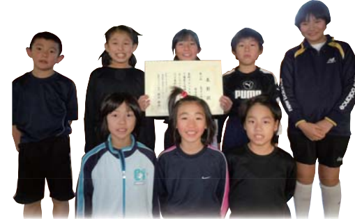
野市東クラブのメンバー